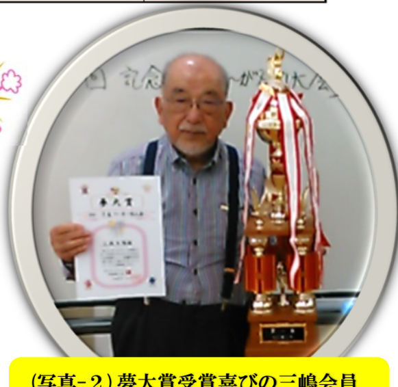
(写真-2) 夢大賞受賞喜びの三嶋会員