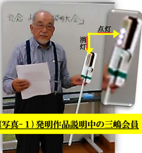
(写真-1) 発明作品説明中の三嶋会員