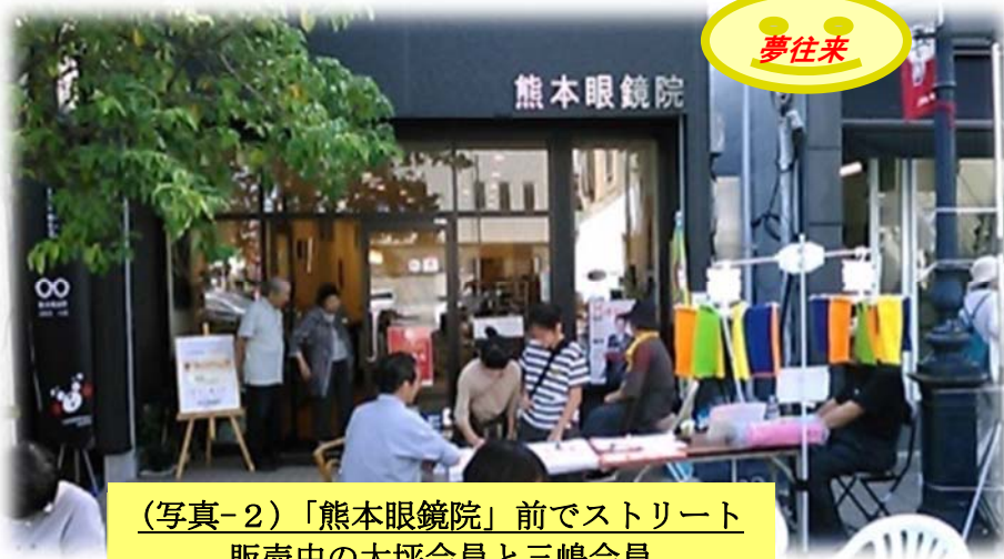
(写真-2)「熊本眼鏡院」前でストリート販売中の大坪会員と三嶋会員