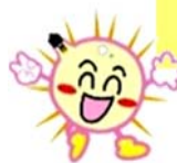
(写真-5)「手づくりフェア」コーナーの案内板