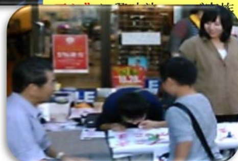
(写真-4)「ジャンプゴマ」チャレンジに夢中の子供さん

なお、今回は上記「ストリート販売」への参加でしたが、日頃はこの「えびす祭」が開催された上通り並木坂のメガネ店「熊本眼鏡院」(写真-2)(☎096-352-9009、創業86年)の「手づくりフェア」のコーナー(写真-5)に展示しています。