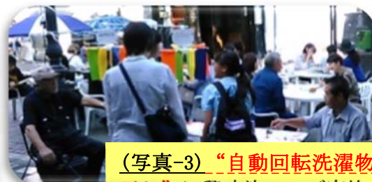
(写真-3)「自動回転洗濯物干し」の体験