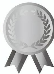
準夢大賞金メダル