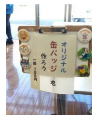
缶バッジ制作の看板