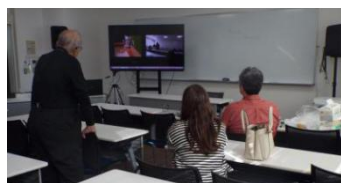
Web 参加発表をモニターで視聴

今回は参加者が若干少ない大会になりましたが、大会進行は例年通り各人発表したあと、審査投票し、表彰式まで無事に終了しました。大分県から Zoom での Web 参加もありましたが、大きなトラブルなくよかったです。