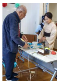
来客者に 三嶋会員の 作品の説明をする

今年も昨年に続き、11月16日（日）開催された「あいぽーと FESTIVAL」に出展参加しました。今年のイベントは、やや縮小気味で来場者も少なかったようです。私達は発明作品の展示に加え、昨年までの「ジャンプこま」体験と今回新しく「缶バッジ制作」の実演やオリジナル制作体験を準備しました。しかし子供達がいなかったため、少し寂しい結果でした。